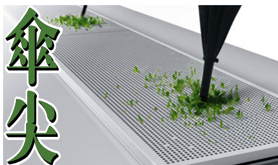
▲ 巧妙的設計，既不會弄臟地板又有盆栽功能。