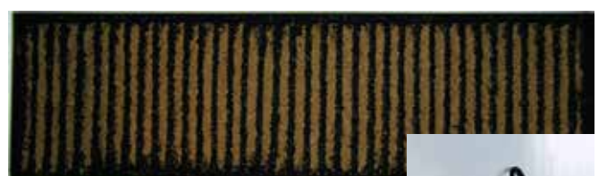
▲ 原來網板裏內有乾坤。

下 雨後留在傘面上的雨水可是一筆不小的水資源，利用起來，可以節水又不會沾污地面。也看過不少在傘上面下功夫的設計，都想把那一點水利用起來，不如看看在傘放置地方的設計，一塊白色的帶孔的面板，平白無奇，但是一個雨季之後，卻發現裏面長出點點的綠色。